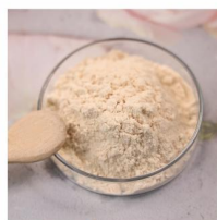
Fruit Vinegar Powder