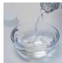
Glacial Acetic Acid (food grade)