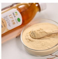
Rice Vinegar Powder