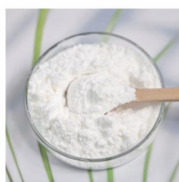
White Vinegar Powder