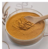
Soy Sauce Powder