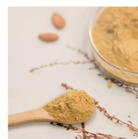
Mature Vinegar Powder