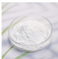
Buffered Vinegar Powder